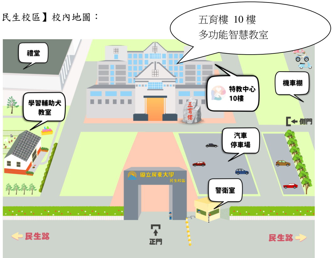
【民生校區】校內地圖：